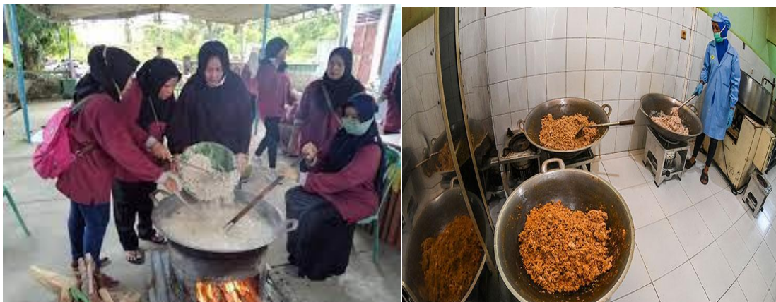
Gambar 1. Kegiatan Pengabdian Abon Sapi

Seiring dengan perkembangan waktu, teknologi pengolahan makanan saat ini telah berkembang pesat. Produsen telah menggunakan beberapa teknologi seperti halnya metode penggorengan, bahan tambahan makanan, bahan pengawet, bahan pewarna dan sebagainya pada produk makanan dan minuman. Komunikasi antara produsen dan konsumen perlu dikembangkan dengan pencantuman label dan sertifikasi yang dimiliki. Pencantuman labelisasi dan sertifikasi serta informasi nilai gizi pada produk atau kemasan merupakan tidak hanya sebagai bentuk komunikasi semata, melainkan juga upaya perlindungan terhadap konsumen. Sebagai contoh labelisasi dan sertifikasi halal menjadi sebuah jaminan konsumen terhadap kehalalan produk tersebut. Informasi nilai gizi memperlihatkan kandungan dan asupan gizi yang ada dan dapat dimanfaatkan untuk kesehatan.