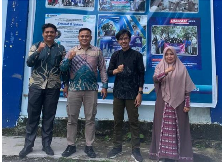
Tim Pelaksana Kegiatan Pelatihan